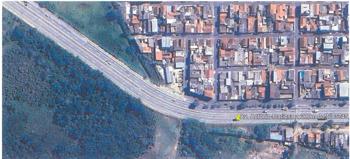
Vista Superior